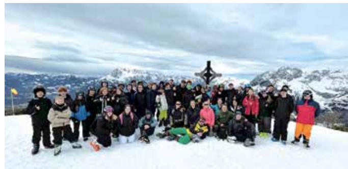
Es gehört mittlerweile dazu, dass man sich während der Abfahrten zum gemeinsamen Gruppenbild versammelt. Beeindruckt sind die Sielmänner von der imposanten Bergkulisse in Werfenweng.

In den kommenden Wochen stehen an der Oerlinghauser Schule noch weitere Fahrten an. So besucht die sechste Jahrgangsstufe die Insel Norderney, während die zehnte Jahrgangsstufe ihre Abschlussfahrt nach Berlin macht. Nach den Abschlussprüfungen warten zudem noch zwei Themenreisen auf die Zehntklässler. Während eine Gruppe der britischen Hauptstadt einen Besuch abstattet, fährt eine andere Gruppe nach Polen.