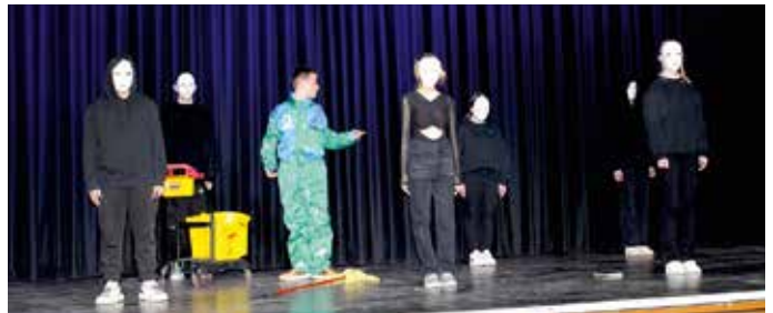
Ein Hausmeister erlebt »Nachts im Museum« besondere Erlebnisse, gekonnt in Szene gesetzt von den Schülerinnen und Schülern der 8. Jahrgangsstufe.

Brachtshof 6 Telefon 05202/5395 33813 Oerlinghausen Fax 05202/5141 mail@tintelnot-kramme.de · www.tintelnot-kramme.de