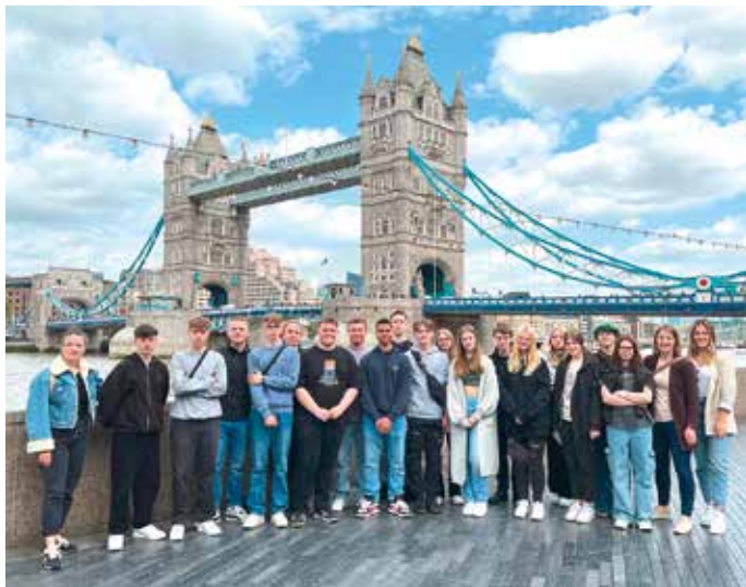
Die Heinz-Sielmann-Sekundarschüler besuchten auf ihrer 5-tägigen Sprachreise wieder zahlreiche Sehenswürdigkeiten der britischen Metropole. Bei bestem Wetter stattete man auch der Tower Bridge und dem Tower of London einen Besuch ab.