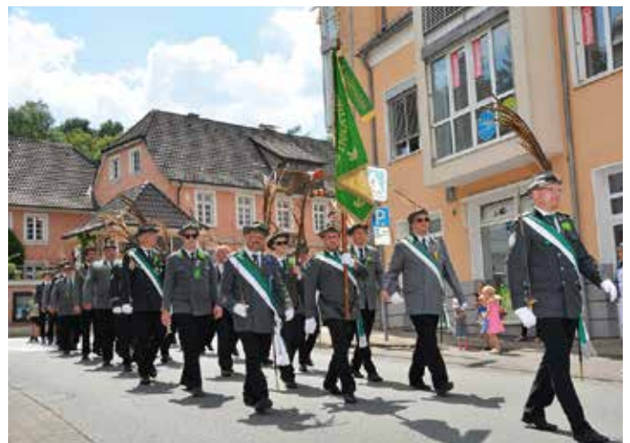
Der Festumzug zum Schützenplatz ist immer wieder ein Hingucker.

Ab 15.30 Uhr steht ein gemütlicher Nachmittag auf dem Schützenplatz auf dem Programm, mit Preisschießen, Musik und einer großen Tombola. Während sich die Kompanien in ihren Revieren zum »Kompaniefass« treffen, können die Kinder auf einer großen Hüpfburg toben und die Erwachsenen bei Kaffee und Kuchen, Kaltge-