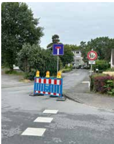
Biegt man rechts in die Straße »Auf dem Sande« ein, versperrt eine zuvor nicht sichtbare Absperrbarke den Weg.

Auch die Lage der vorübergehend eingerichteten Kundenparkplätze ist schlecht bzw. gar nicht beschrieben und bei der Einfahrt vom Stukenbrocker Weg aus nicht auszumachen. Viele sehen aus der Entfernung nur die Straßenbarken und fahren gar nicht erst weiter – sehr zum Nachteil der betroffenen Geschäftsleute. Daher sei hier noch einmal darauf hingewiesen, dass es vom Stukenbrocker Weg aus kommend auf der rechten Seite gegenüber der Einfahrt zu den Glascontainern drei Parkplätze auf einer geschotterten Fläche gibt und zudem in der Von-Stauffenberg-Straße vor dem ersten Wohnhaus vier Plätze während der Geschäftszeiten für Kunden reserviert sind. Kommt man aus der anderen Richtung, finden sich gegenüber der Einfahrt zum Ginsterweg drei Parkplätze auf dem Streifen der Bushaltestelle, die ebenfalls während der Geschäftszeiten nur für Kunden reserviert sind. Angemerkt sei noch, dass auf beiden Seiten des gesperrten Straßenabschnitts ausreichend Platz zum wenden ist. Einen Wermutstropfen gibt es aus Kundensicht jedoch. Diese haben nämlich beobachtet, dass in den Nachmittags- und frühen Abendstunden sowie am Samstag die Plätze vorwiegend durch Anwohner belegt sind. Hier kann wohl nur eine Parkraumüberwachung für Abhilfe sorgen.