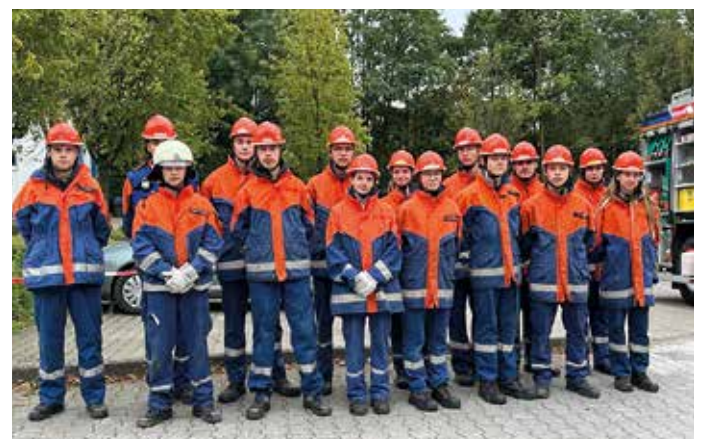
Die 15 Mitglieder der Jugendfeuerwehr Oerlinghausen, die zum 24-Stunden-Dienst angetreten sind.

Dann wurden die ersten »kleinen« Rettungseinsätze durchgeführt. Während ein Teil der Gruppe die Rettung einer Katze aus einem Baum mit Drehleitereinsatz zu bewerkstelligen hatte, musste der andere Teil einen umgestürzten Baum über einer Fahrbahn beseitigen. Beides Fälle, die häufiger vorkommen als man so denkt. »Unsere Arbeit erstreckt sich ungefähr zu einem Drittel auf's Brand löschen, der weit größere Teil aber ist technische Hilfeleistung«, so Willrich. Am späten Nachmittag ging es für die 15 jungen Leute – darunter vier Mädchen – zum »Einsatz« auf den Bauhof. Hier wurde anhand eines alten Autos, das der Feuerwehr von Eltern vor der endgültigen Verschrottung für Trainingszwecke gespendet wurde – geübt, wie eine patientenorientierte Rettung aus einem verunfallten Fahrzeug durchzuführen ist. Zum Einsatz kamen dabei Rettungssprei-