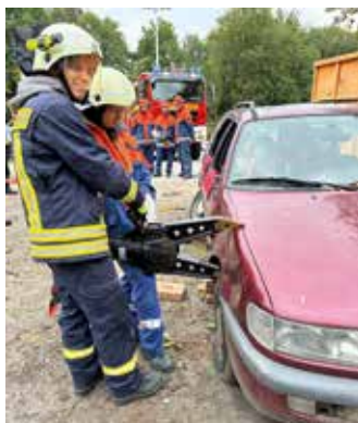
Bevor die A-Säule durchtrennt wird, geht es dem Kotflügel »an den Kragen«, um einen Spalt zum Ansetzen des schweren Rettungsspreizers zu bekommen.

rück in die Feuerwache, bevor sich die Gruppe zum Schlafen legte. Aber wie es auch im Ernstfall immer sein kann, hatte sich das Vorbereitungsteam noch einen weiteren Einsatz einfallen lassen. Um 6.00 Uhr in der Früh ging der »Notruf« ein, in dem der Brand eines Gartenhauses gemeldet wurde. Also hieß es, fix rein in die Klamotten und ausrücken zum Löscheinsatz. Gegen 11.00 Uhr am Sonntagmorgen gingen für die Jugendlichen nach einem gemeinsamen Frühstück und Aufräumen lange 24 Stunden zuende, die sowohl anstrengend waren aber auch durch viel Spaß und Kameradschaftsgefühl geprägt wurden. In drei Wochen gibt's schon den nächsten 24-Stunden-Tag, dann sind nämlich die 10- bis 14-Jährigen an der Reihe.