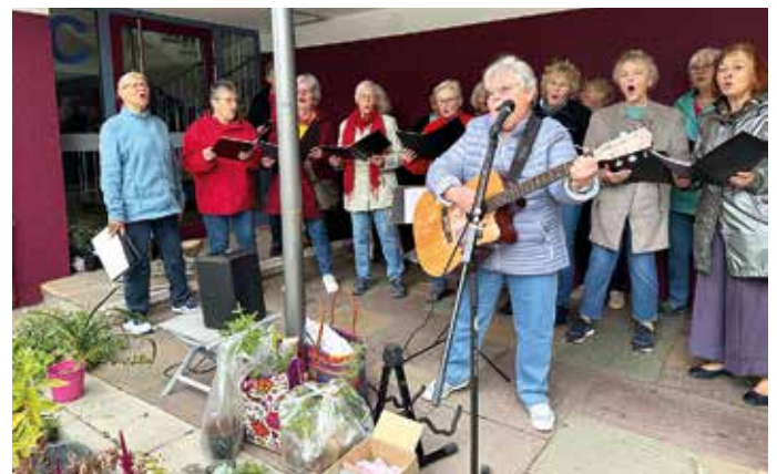
Gut bei Stimme war der Agenda Chor, der die Jubiläumsausgabe der Pflanzentauschbörse musikalisch bereicherte.