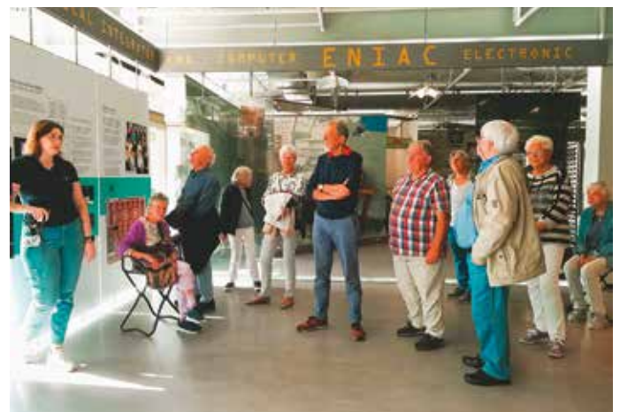
In zwei Gruppen aufgeteilt erfuhren die Senioren der SPD-AG 60 plus viel Wissenswertes im Heinz-Nixdorf-Museumsforum.

Im Heinz-Nixdorf-Museumsforum, dem größten Computermuseum der Welt, wurden die wissbegierigen Seniorinnen und Senioren der SPD-AG 60 plus aus Oerlinghausen fachkundig durch die Geschichte der Informations- und Kommunikationstechnik geführt, von den historischen Anfängen bis hin zu den neuesten Entwicklungen. Dabei bestaunten sie an vielen Objekten und Ausstellungsstücken, wie Schrift und Zahl im Laufe der letzten Jahrhunderte mechanisiert wurden. Augen und Ohren wurden mit einer schwer zu erfassenden Anzahl an Begriffen wie Tontafel, Pergament, Lochkarte, Elektronenröhre, Mikrochip oder KI gefordert. Eine leichte Erholung gab es, wenn einige Exponate aus der zurückliegenden Berufszeit der Teilnehmer noch vertraut oder bekannt waren. »Der Besuch hat sich gelohnt, war aber anstrengend!«, diese Meinung klang dem Berichterstatter vorwiegend entgegen. Eine ersehnte Erquickung fanden alle im nahen Cafe in der Abendsonne mit Blick auf die idyllisch mäandrende Pader.