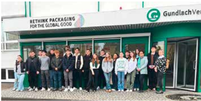
Die Klasse 10c war eine von drei Abschlussklassen der Heinz-Sielmann-Schule, die den neuen Kooperationspartner, die Firma Gundlach Verpackungen, kennengelernt haben.

Einer der Höhepunkte der Betriebsbesichtigung war dann die Führung durch die Produktionshallen. Beeindruckt waren die Jugendlichen von der Vorstellung der verschiedenen Druckverfahren und den umfassenden Informationen, die die Auszubildenden des ersten und zweiten Lehrjahres für die Sielmänner vorbereitet hatten. Freuen konnten sich am Ende noch einige Schülerinnen und Schüler über einen Präsentkorb, den sie bei einem Kahoot-Quiz über den neuen Kooperationspartner der Sekundarschule gewonnen haben.