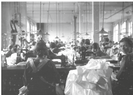
Blick in eine Oerlinghauser Wäschefabrik.

Oerlinghausen »tickte« politisch schon immer anders als seine Umgebung. Durch die frühe Industrialisierung entwickelte sich schneller und stärker eine organisierte Arbeiterschaft. Daher bietet sich gerade für unsere Stadt ein Rundgang sozusagen von unten an. Also nicht zu den großen Denkmälern, sondern zu den Orten der einfachen Leute. Wo und wie haben sie gelebt, gearbeitet und wie konnten sie sich trotz massiver politischer Benachteiligung organisieren?