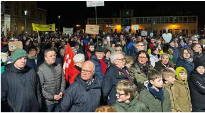
Etwa 1300 Menschen kamen auf dem Rathausplatz zusammen, um sich für Vielfalt und Toleranz zu positionieren.

Zusammenhang an das Inkrafttreten der Ermächtigungsgesetze, für deren Einführung die NSDAP nur zwei Monate gebraucht hatte. Damit wurden seinerzeit wesentliche Grundrechte außer Kraft gesetzt, darunter die Versammlungs-, Meinungs- und Pressefreiheit, aber auch die Unverletzlichkeit der Wohnung sowie das Post- und Fernmeldegeheimnis.