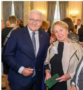
Bundespräsident Frank-Walter Steinmeier und Ulrike Meusel.

Auf Einladung von Bundespräsident Frank-Walter Steinmeier und der Körper-Stiftung reiste Ulrike Meusel, dritte stellvertretende Bürgermeisterin von Oerlinghausen und GRÜNEN-Politikerin, Mitte April für zwei Tage nach Berlin. Gemeinsam mit 80 weiteren ehrenamtlichen Bürgermeisterinnen und Bürgermeistern aus ganz Deutschland nahm sie an der Veranstaltung »Demokratie beginnt vor Ort« teil. Das Treffen stellt das ehrenamtliche Engagement in den Mittelpunkt und würdigt den Einsatz