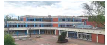
Beide Schulen im Zentrum der Stadt sind in die Jahre gekommen.