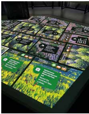
Auf dem »Hüpfboden« kann man in Sachen Klimarettung Punkte gut machen.

Überforderung breit gemacht. In der KlimaErlebnisWelt kann man daher nicht nur erleben, was auf uns zukommen kann, sondern es wird auch vermittelt: Ich kann etwas ändern!