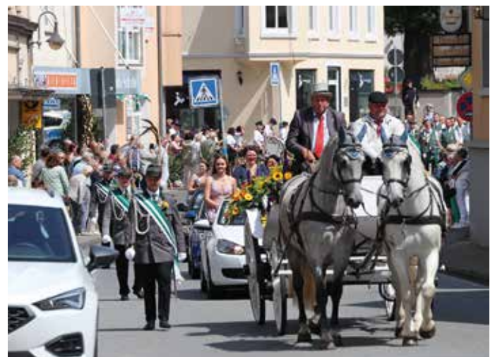
Der Große Festumzug mit einer Kutsche und den Majestäten vorweg ist der Höhepunkt am Schützenfestsonntag.