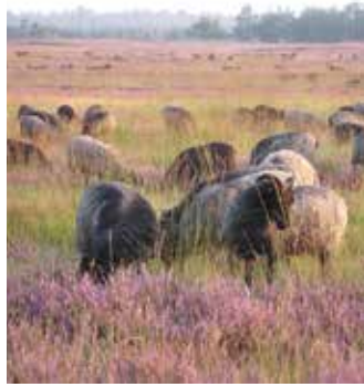
Schafe in der Heide.

Die Biologische Station Kreis Paderborn – Senne e.V. lädt Groß und Klein aus Nah und Fern am 18. August von 11.00 bis 18.00 Uhr ein, mit ihr das »Sennefest zur Heideblüte« zu feiern. Auf dem Gelände der Heidschnuckenschäferei Senne, Sennestraße 233 in Hövelhof, warten viele Angebote zum Erleben der einzigartigen Sennennatur auf die Besucher.