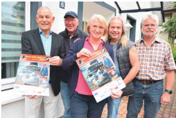
Der »Rock gegen Krebs«-Vorstand lädt zum The Rattles Konzert und Kartenvorverkauf am 23. August herzlich ein.

Auch »Mariuzz«, eine der besten Marius Müller-Westernhagen Tribute-Bands Deutschlands, wird mit Hits wie »Freiheit«, »Willenlos« oder »Mit Pfefferminz bin ich dein Prinz« in einer 75-Minuten-Show