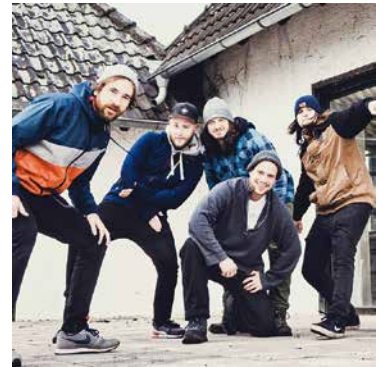
»Spin My Fate« aus Münster

Der Einlass zum Konzert beginnt um 19.00 Uhr, auf der Bühne geht es um 19.30 Uhr los. Der Eintritt kostet zwischen 8 und 13 €. Alle weiteren Infos, auch zum Vorverkauf, finden sich auf der Website vom Soziokulturellen Zentrum Oerlinghausen: www.knup.org