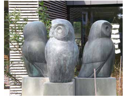
Die Bronze-Gruppe »Drei Eulen« von Inge Jäger-Unthoff aus dem Jahr 1964 ist nur eine von mehr als 30 Skulpturen in Sennestadt.

Wussten Sie, dass es in Sennestadt mehr als 30 Skulpturen gibt? Sie begegnen einem überall, werden aber oft übersehen. Der Sennestadtverein möchte das ändern und lädt zu einem gemeinsamen Spaziergang durch die Sennestadt ein. Im gemütlichen Tempo werden dabei die Kunstwerke besucht, die fußläufig gut zu verbinden sind. Der Spaziergang dauert etwa zwei Stunden und die Teilnehmer werden überrascht sein, auf welche Zahl an besuchten Skulpturen man dabei kommt.