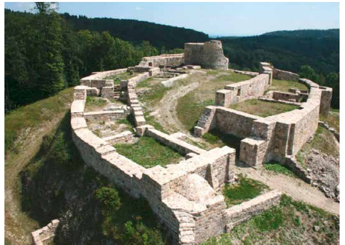
Die Falkenburg war Sitz der Edelherrn zur Lippe.

An beiden Orten gibt es eine fachkundige Führung. Start der Tagestour ist am Dienstag, dem 1. Oktober, um 9.30 Uhr auf dem Parkplatz an der Marienstraße gegenüber der Sporthalle der Heinz-Sielmann-Schule. Die Teilnahme kostet inklusive Mittagessen 29 €. Anmeldung bitte bis zum 17. September per E-Mail an wolfgangschmelz@gmx.net oder telefonisch unter 0 52 02 / 92 64 10.