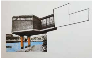
»Ente (NT) Vortragssaal«

Mit »aNsichTen« bringt der Bielefelder Künstler Uli Horaczek auf Einladung des Sennestadtvereins eine außergewöhnliche Kunstinstallation in den Vortragssaal des Sennestadthauses am Lindemann-Platz 3 in 33689 Bielefeld. Die Vernissage findet am Sonntag, dem 15. September um 11.15 Uhr statt.