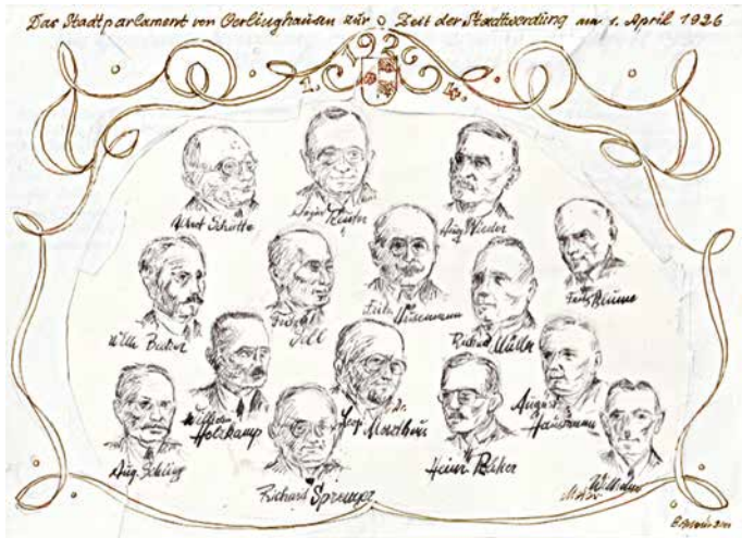
Zeichnung Ernst Meier, Archiv Werner Höltke, Repro W. Nowak.

Darüber, und über die Bürgermeister danach, berichtet der Ortshistoriker Werner Höltke in einem Vortrag beim Oerlinghauser Heimatverein am Dienstag, dem 3. Dezember um 18.00 Uhr im Jägerhaus, Hauptstraße 21. Es wird herzlich eingeladen.