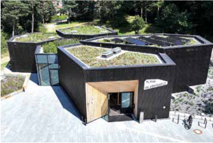
Die Klimaerlebniswelt in Oerlinghausen ist mit dem Red Dot Design Award ausgezeichnet worden.

direkt vor Ort ein Beispiel für klimaangepasstes und ressourcenschonendes Bauen erkunden.«