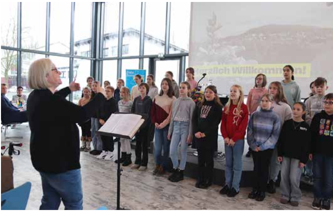
Der HSS-Schulchor sang zur Begrüßung für die Gäste.