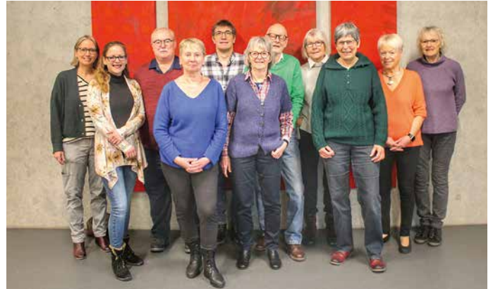
Das »Team-Grünkohl« sorgte für ein geselliges Miteinander.

Die Gäste genossen ein leckeres Essen in gemütlicher Atmosphäre. Gerne wurde auch die Möglichkeit wahrgenommen, anschließend bei Kaffee und Gebäck miteinander ins Gespräch zu kommen. Es wurde deutlich, dass derartige Veranstaltungen zur Stärkung der Gemeinschaft gerade in der Südstadt sehr willkommen sind.