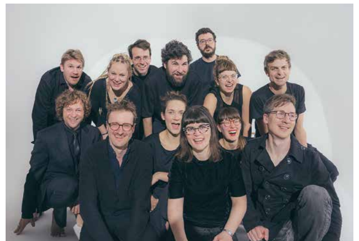
Voller Spielfreude und Elan: das Ensemble von Été Large.

Weitere Infos gibt's unter www.luisevolkmann.com/ete-large im Internet. Der Eintritt zu allen Veranstaltungen ist frei, Spenden sind willkommen. Das Projekt wird vom Musikfonds und der Beauftragten der Bundesregierung für Kultur und Medien gefördert.